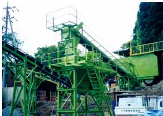
▲RC生産ライン (長野県S社)

グランドホッパー・グリズリフィーダーアンダーシュート内側にゴムライナーを標準装備。ジョークラッシャー・スクリーン架台下に防振ゴムを標準装備。騒音、振動については、発生源で万全対策施工済。