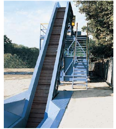
エプロンコンベヤー