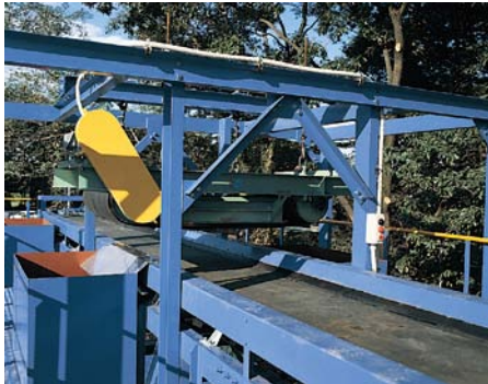
マグネットセパレーター