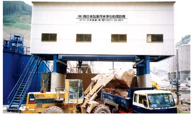
● フィルタープレス建屋