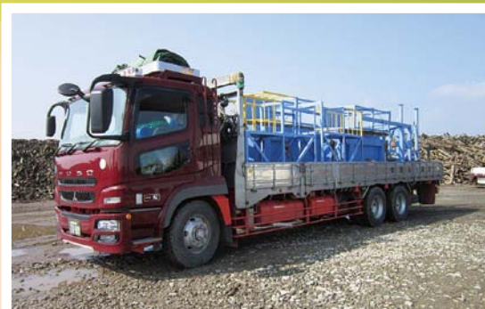
搬送：大型トラック2車