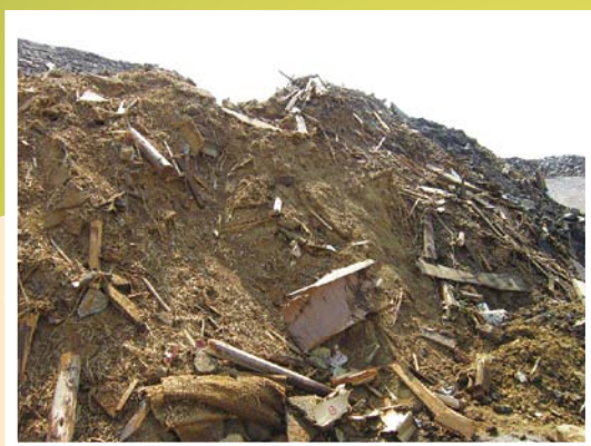
選別対象物：混合廃棄物